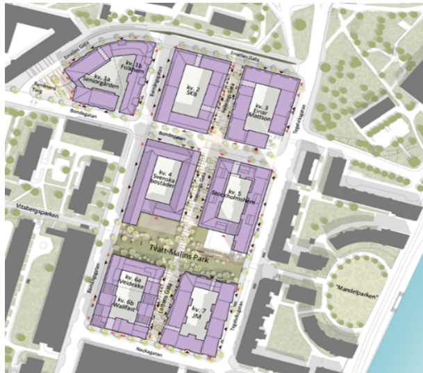
Situationsplan av planerade bostadskvarter i området.