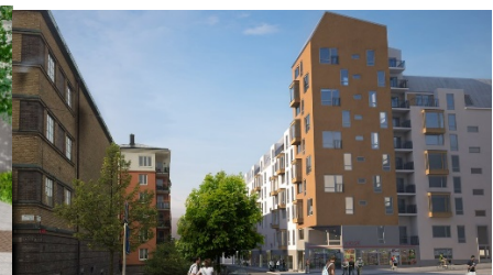
Illustrations av Bondegatan