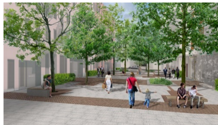
Illustration av Hennings gata